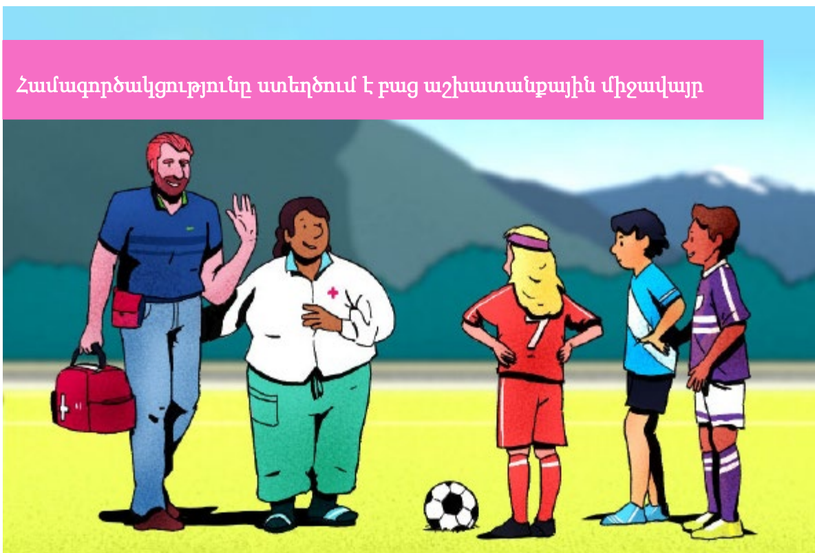
Համագործակցությունը ստեղծում է բաց աշխատանքային միջավայր

4.1.3 ՀՖՖ-ն խրախուսում է երեխայի պաշտպանության հարցերով պատասխանատուներին, ինչպես նաև ֆուտբոլի բնագավառում աշխատող այլ անձանց մշտապես հաճախել երեխաների պաշտպանության և անվտանգության մասին դասընթացների, որոնք կառաջարկեն ՀՖՖ-ն կամ այլ իրավասու կազմակերպությունները: